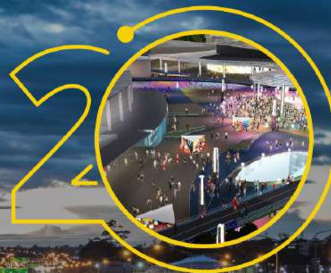
Льодова арена «Метеор»: SPORT&EXPO ARENA