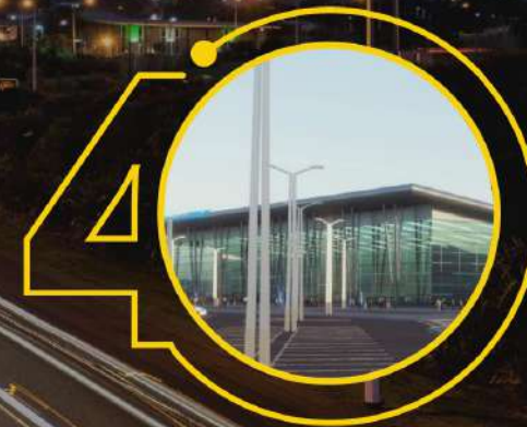
Cargo-термінал у міжнародному аеропорту «Дніпро»