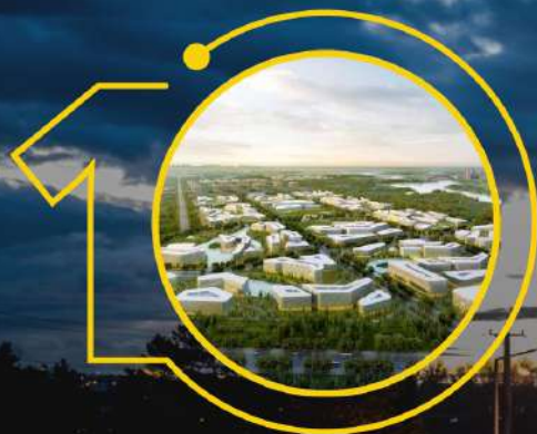
Індустріальний парк «Павлоград»