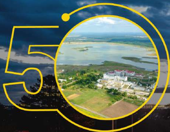
Курорт навколо озера «Солоний Лиман»