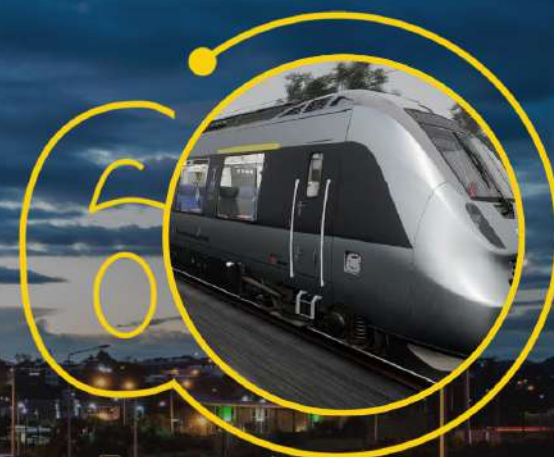
Оновлений міжміський електротранспорт