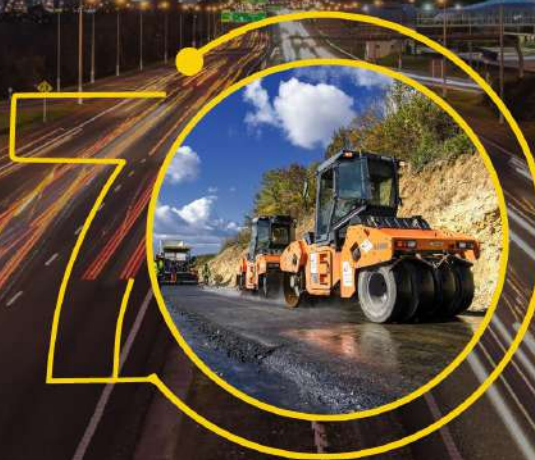
Ремонт обласних доріг - концесія, кредитування