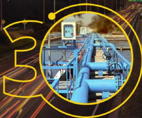
Водоканал «Дніпро-Західний Донбас»